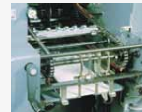
Lubrificação de correntes de transporte da indústria do papel e de embalagens