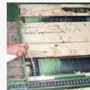
Lubrificação das correntes de sistemas de transporte e de paletagem