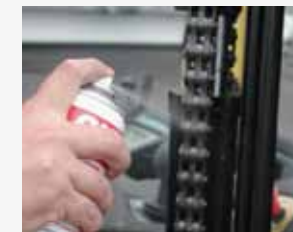
Lubrificação das correntes de empilhadores de garfo